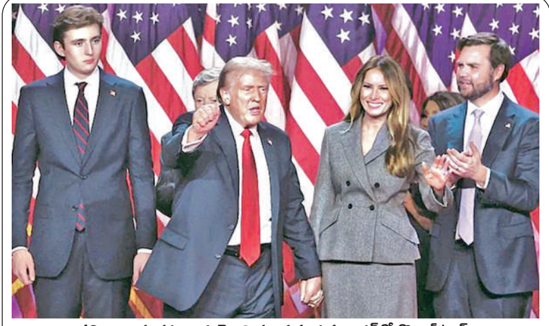
ఫలితాల అనంతరం భార్య మెలనియా, కుమారుడు బారన్ తో డొనాల్డ్ ట్రంప్