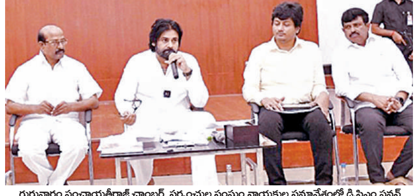
గురువారం పంచాయతీరాజ్ ఛాంబర్, సర్పంచల సంఘం నాయకుల సమావేశంలో డి.సిఎం పవన్

విజయవాడ, నవంబరు 7, ప్రభాతవార్త ప్రతినీధి: పంచాయతీరాజ్ వ్యవస్థను అత్యంత పటిష్టంగా తీర్చిదిద్దడానికి ఉప ముఖ్యమంత్రి పవన్ కల్యాణ్ సర్పంచ్లను కలిశారు. గత ప్రభుత్వం పంచాయతీరాజ్ వల్ల అభివృద్ధి చెందిన సర్పంచ్లను నిర్వహించే సాధనం చేసిందిన్నారు.