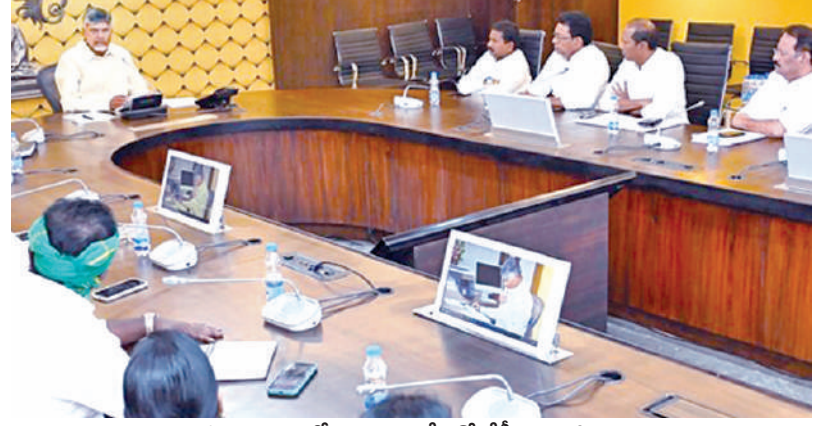
గురువారం సవివాలయంలో దళిత ఎమ్మెల్యేలతో భేటీ అయిన సిఎం చంద్రబాబు

విజయవాడ, నవంబరు 7, ప్రభాతవార్త ప్రతినీధి: దళిత ఎమ్మెల్యేలతో ముఖ్యమంత్రి చంద్రబాబు నాయుడు సవివాలయంలో సమావేశమయ్యారు. దళిత వర్గీకరణ విషయంలో తీసుకోవాల్సిన చర్యలపై కుటుంబీకల దళిత ఎమ్మెల్యేలతో ముఖ్యమంత్రి చర్చించారు. వర్గీకరణ అమలు ద్వారా దళిత వర్గీకరణ ఉప కులాలందరికీ దామాషా ప్రకారం సమాన అవకాశాలు కల్పించి వారికి ఊతం ఇచ్చేలా పనిచేయాల్సిన అవసరం ఉందని సిఎం అన్నారు. వర్గీకరణపై సుప్రీం కోర్టు తీర్పుతో పాటు... ఎన్నికల హామీ కూడా ఉన్నందున కార్యాచరణపై ఎమ్మెల్యేలతో సిఎం చర్చించారు. జనాభా దామాషా పద్ధతిలో జిల్లా ఒక యూనిట్ గా వర్గీకరణ అమలు చేస్తామన్నారు. సమైక్య ఆంధ్రప్రదేశ్ లో ఉన్నప్పుడు వర్గీకరణ అమలు చేశామని... తరువాత న్యాయ సమస్య కారణంగా ఆ కార్యక్రమం నిలిచి